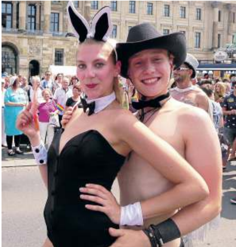
Auf sonniges Wetter hoffen die Teilnehmer für die Parade des Sommerlochfestivals der Schwulen und Lesben.